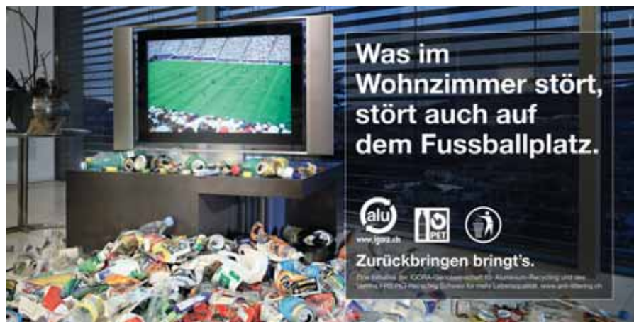
Kampagne gegen Littering: PET-Recycling Schweiz und IGORA sensibilisieren mit neuen Sujets und Slogans.

> An der Vorjahreskampagne beteiligten sich über 600 Städte und Gemeinden und appellierten mit 10 000 Plakaten für Sauberkeit auf Strassen und Plätzen. Auch dieses Jahr können Städte und Gemeinden wieder kostenlos Plakatsujets bestellen. Bereits jetzt zeichnet sich ab, dass die Kampagne auch erfolgreich verlaufen wird: Städte und Gemeinden haben bereits 9000 Plakate vorbestellt. Mit der Einführung des Verhaltenskodex des Schweizerischen Städteverbandes werden neu auch Takeaways und Imbissbuden an der Kampagne beteiligt. Eigens gestaltete Thekensteller und Deckenhänger, so genannte Rotairs, können kostenlos unter www.anti-littering.ch bestellt werden.