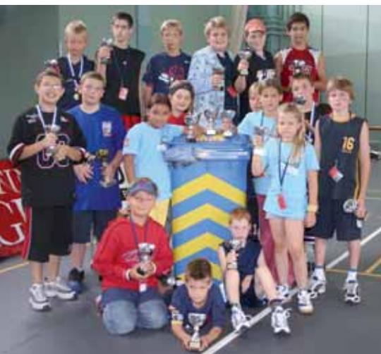
Das Gewinnerteam des letztjährigen PET-Sammelcontests. Jedes Kind hat einen kleinen Pokal erhalten.

Rund 800 Kinder und Jugendliche sammeln diesen Sommer PET, anlässlich des «24. NIKE Swiss Allstar Basketball Camps» in Zofingen und kämpfen um die beliebten PET-Sammlerpokale.