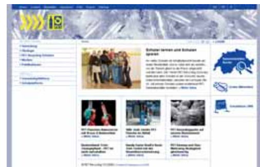
Die neue Website bietet die Möglichkeit, sich einen kurzen Überblick über PET-Recycling zu verschaffen.

versen Informationsbroschüren, Unterrichtsmaterialien oder Plakate erfolgt die Bestellung neu online. Die Webpages bauen auf Kurzinformationen auf. Ausführlichere Erläuterungen können als ganzes Dokument heruntergeladen werden. Für weiterführende Informationen zu verwandten Themen befinden sich Links auf der rechten Seite der Webpage. Die Website verfügt, neben nützlichen Details rund um die PET-Sammlung, auch über eine ausführliche Schulplattform. Praktische Beispiele aus dem Schulalltag, Unterrichtsmaterial und auch eine Seite speziell für Schüler und Schülerinnen sind aufgeschaltet. □