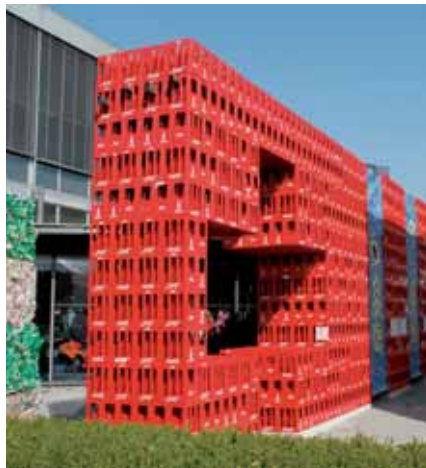
PET, PET und nochmals PET an der Sonderausstellung im Verkehrshaus Luzern. Durch die kreuzförmige Öffnung in den Harassen führt der Weg direkt zu den vier Meter hohen PET-Pressballen. Die PET-Einwurföffnungen rechts vom Kreuz gehören zum Recyclingspiel.

Unter den zahlreichen Bewerbern wurde PET-Recycling Schweiz ausgewählt. «Mit