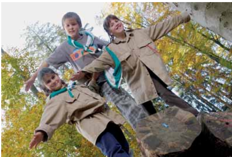
Pfadis setzen sich mit dem Wettbewerb für die Umwelt ein und sind Vorbild für die Jugendlichen.

Ein lohnenswertes Engagement: Jede Gruppe erhält während der Aktion 2 Rapen pro gesammelte PET-Flasche oder Aludose. Im Herbst werden zusätzlich die zehn besten Konzepte auserkoren und mit je 2000 Franken in die Kasse belohnt. Ein willkommener Zustupf, den die Pfadis für Zelte, Übungen und Pfadilager verwenden.