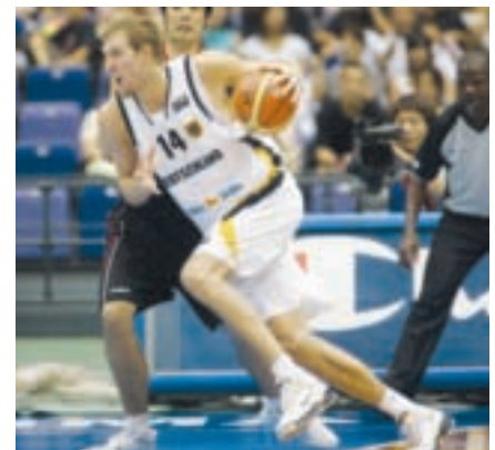
Dirk Nowitzki zeigt den Kids coole Basketballtricks.

Tricks weitergeben, die eben nur wirkliche Köpfer auf Lager haben. Die Begegnung mit dem derzeit besten europäischen Basketballspieler wird ein unvergessliches Erlebnis sein, an das nach dem Camp mindestens eine Autogrammkarte noch lange erinnern wird. Natürlich zeichnet PET-Recycling Schweiz auch im Jubiläumsjahr diejenige Gruppe mit einem Pokal aus, die im Laufe der Woche am meisten PET-Getränkeflaschen sammelt. □