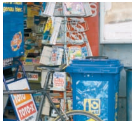
Viele Kioske und Tankstellen bieten noch immer keine Möglichkeit, PET-Getränkeflaschen korrekt zu entsorgen.

Viele Gastrobetriebe und insbesondere Take-aways sammeln noch kein PET. Deshalb hat PET-Recycling Schweiz 2006 in fünf Geschäften von Prodega/Growa Cash & Carry Promotionen durchgeführt und über den Ablauf der PET-Sammlung informiert. Kunden konnten eine Erstausrüstung an PET-Sammelbehältern beziehen. Mit diesen Promotionsaktionen