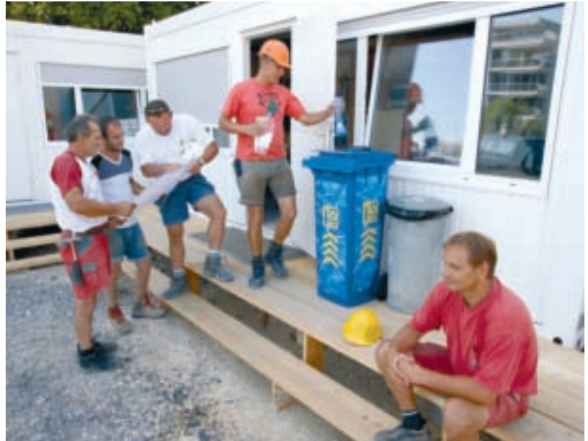
PET-Sammeln auf der Baustelle funktioniert reibungslos und ist ein voller Erfolg.