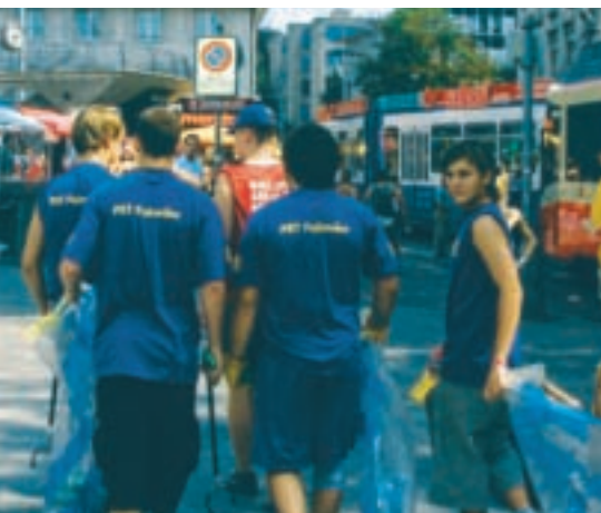
Mit bis zu 80 Personen am Züri Fäscht 2007.

> Im Jahr 2007 wird PET Recycling Schweiz wiederum gegen 1000 Freizeitveranstaltungen mit der nötigen PET-Sammelinfrastruktur ausrüsten – und das kostenlos. Hunderte von kleinen und die meisten der grossen Veranstaltungen (u.a. Eidgenössisches Turnfest, Eidgenössisches Schwingfest, diverse Open Airs usw.) arbeiten mit PRS zusammen. Das Angebot umfasst die Gratislieferung und -abholung der Sammelbehälter und Säcke.