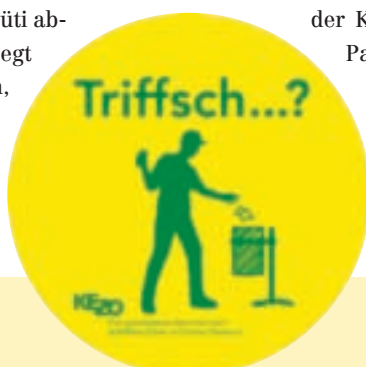
Ein Passant wirft den Abfall korrekt in den Kübel.

Die Aktion ist bei der Bevölkerung sehr gut angekommen. «Triffsch ...?» wurde verstanden und von vielen als geeigneter Beitrag zur Lösung des Litteringproblems gewürdigt. Rüti, Bubikon und Illnau-Effretikon haben deshalb ihre abfallfreien Zonen weiter ausgebaut. Den übrigen Verbandsgemeinden stellt die KEZO die Kampagne gegen Gebühr zur Verfügung. Erste Anfragen sind bereits eingegangen. □