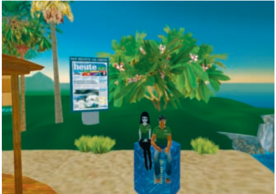
Die Anti-Littering-Botschafterin von PET-Recycling Schweiz Mevanwi Korobase und der «heute»-Korrespondent Roco Camilo wünschen allen beim Wettbewerb viel Glück!

Wer nun diese Insel besucht, ein «heute»-T-Shirt anzieht (gibt es dort kostenlos), sich neben den PET-Container stellt und von sich ein Foto schiesst, erhält 10 000 Linden-Dollars. Einzige Bedingung: Man muss zu den zehn Schnellsten gehören. Einzusenden ist dieses Foto an: info@prs.ch . Die Gewinner und Gewinnerinnen werden auf www.petrecycling.ch mit ihren Fotos veröffentlicht. □