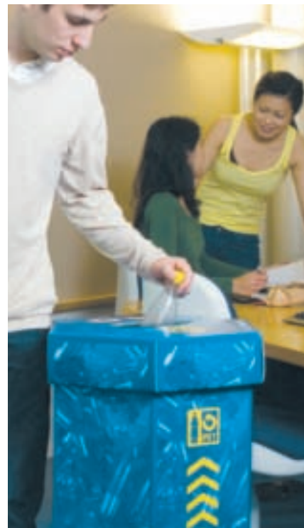
Freiwillige Sammelstellen helfen, die Sammelmengen nachhaltig zu steigern.

Diese neuen Sammelstellen sind hauptsächlich auf den hartnäckigen Ausbau im Service public zurückzuführen. In diesem Bereich verzeichneten Arbeits- und Ausbildungsorte mit einem Plus von 23 Prozent den grössten Zuwachs. Prozentual am meisten haben Bauunternehmen dazu beigetragen. Sie reagierten begeistert auf das Sonderangebot für PET-Sammelcontainer auf Baustellen und überfütterten PET-Recycling Schweiz förmlich mit Bestellungen. Überzeugt hat vor allem das Argument, dass PET-Flaschen auf diese Weise nicht mehr in der Mulde landen und die Baustelle sauberer bleibt. □