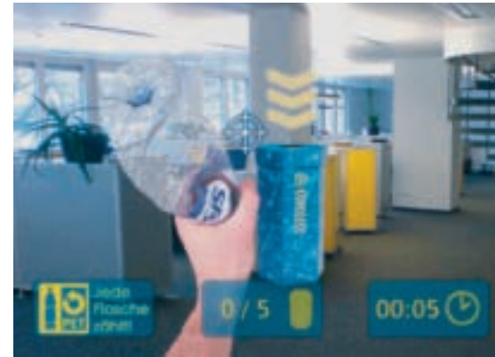
Das Spiel im Internet animiert Mitarbeiterinnen und Mitarbeiter zum PET-Sammeln.

Mit dem Internetspiel setzt PET-Recycling Schweiz im KMU-Bereich neu direkt auf die Angestellten. Sie sollen selbst die