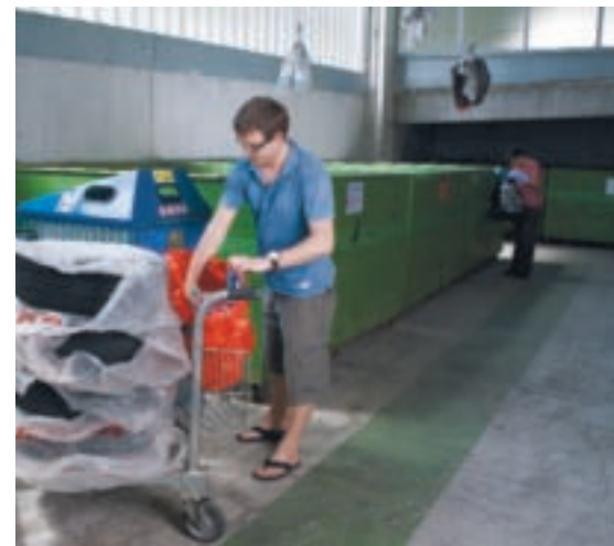
Bequem und einfach: Die Rückgabe von PET bei überwachten Sammelstellen.

Mit dem Sammeln von PET-Getränkeflaschen lasten sich die Gemeinden einen hohen finanziellen und personellen Aufwand auf, der schliesslich von den Steuerzahlerinnen und Steuerzahlern getragen werden muss. Wie auch alle anderen Organisationen, die sich mit dem Recycling von Wertstoffen beschäftigen, ist auch PET-Recycling Schweiz nicht in der Lage, Gemeinden und Städte für Ihren Aufwand kostendeckend abzugelten. Anfang Jahr haben sich PET-Recycling Schweiz, das Bundesamt für Umwelt (BAFU), und der Städte- und Gemeindeverband (FES) auf eine neue Regelung für die finanzielle Entlastung der Schweizer Gemeinden und Städte bei der Sammlung von PET-Getränkeflaschen vorerst geeinigt. Die konkreten Abgeltungssätze sind in Vorbereitung. Bediente Sammelstellen wie Werk-/Ökihöfe werden von PET-Recycling Schweiz bestmöglich entschädigt und das zu Ansätzen, die den Warenwert