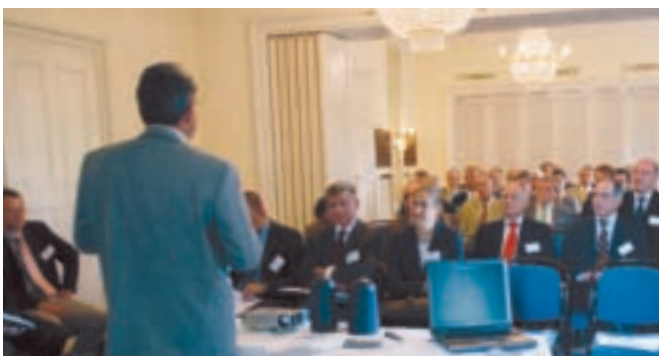
Erfolgreicher Verein PET-Recycling Schweiz.

> Im vergangenen Jahr traten dem Verein PRS PET-Recycling Schweiz die Distributis AG (Carrefour) und die SGA Schweizerische Grosshandelsagentur bei. Per 1. Januar 2007 kamen Aldi Suisse AG, Austrian Products GmbH, Denner AG und Maestral Lubric GmbH dazu. «Damit beteiligen sich heute fast